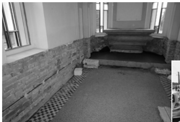
Rekonstrukce interiéru kaple sv. Vavřince

Pokud se na tom zastupitelstvo shodne, chtěli bychom brzy z jara vybavit naše tři dětská hřiště novými uzavíratelnými pískovišti a bezpečnými houpačkami pro malé děti a také opravit některé polní cesty.