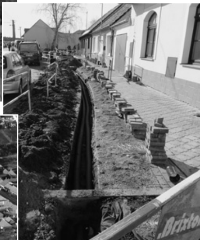
Výkop vedení nízkého napětí a optického kabelu