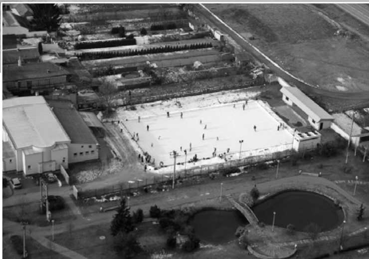
Bruslit na ledové ploše s umělým chlazením jsme mohli téměř 3 měsíce