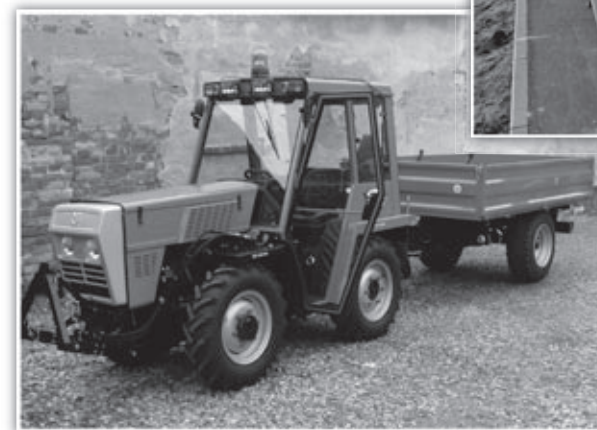
◀ nově zakoupený malotraktor