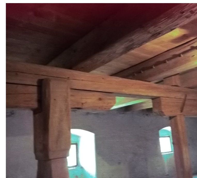
DETAIL HLAVY SLOUPŮ S VAZNICEMI A TRÁMOVÝM STROPEM