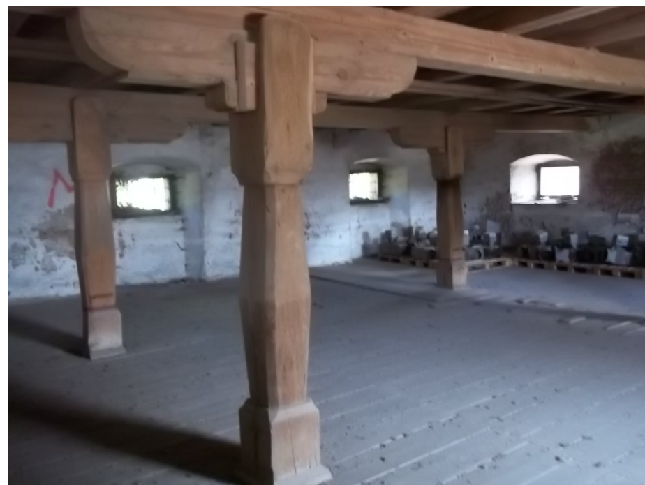
DŘEVĚNÁ NOSNÁ KONSTRUKCE STAVBY