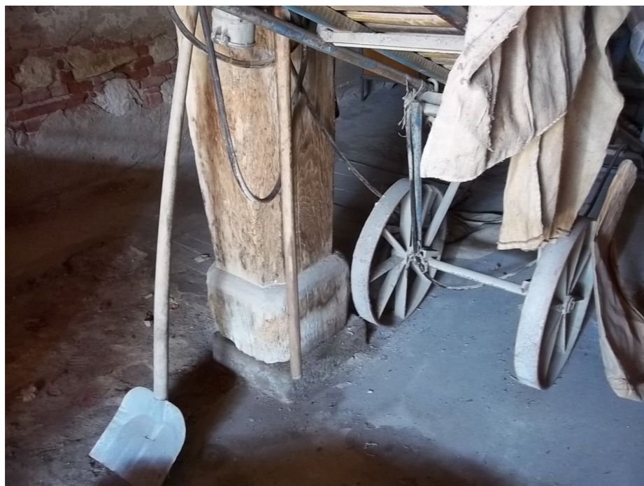
DETAIL PATY PŮVODNÍHO SLOUPU V PŘÍZEMÍ