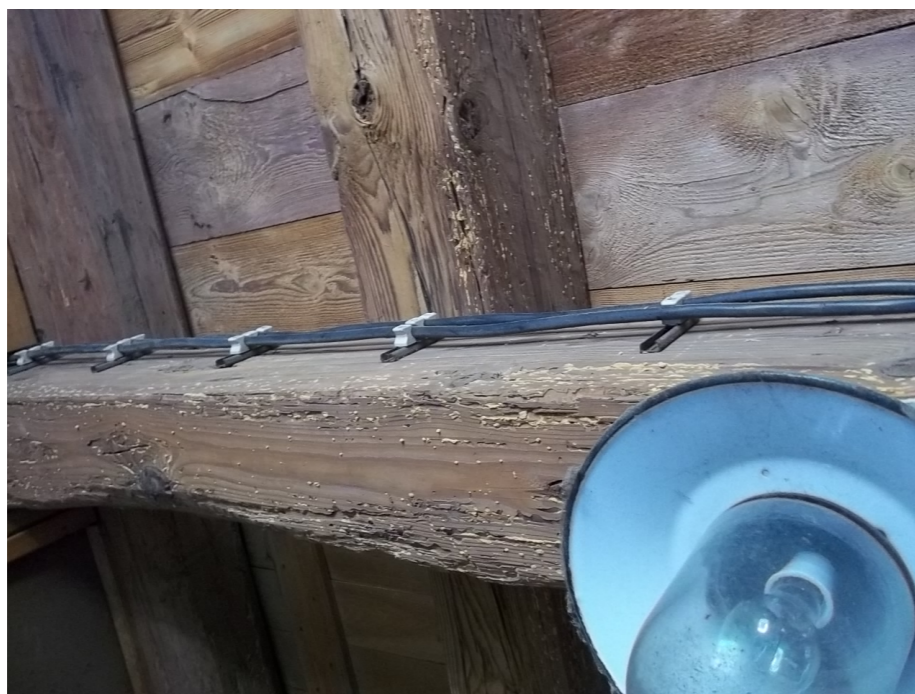
DETAIL STROPU - DESTRUKCE DŘEVNÍ HMOTY