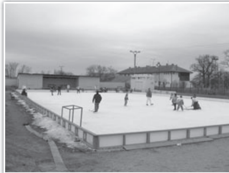
Ledová plocha s umělým chlazením