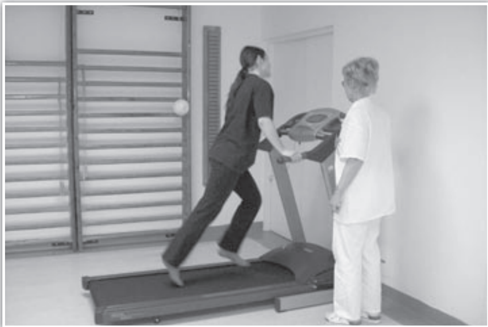
Běžecký pás KETTLER-TRAVELLER s nastavitelným sklonem