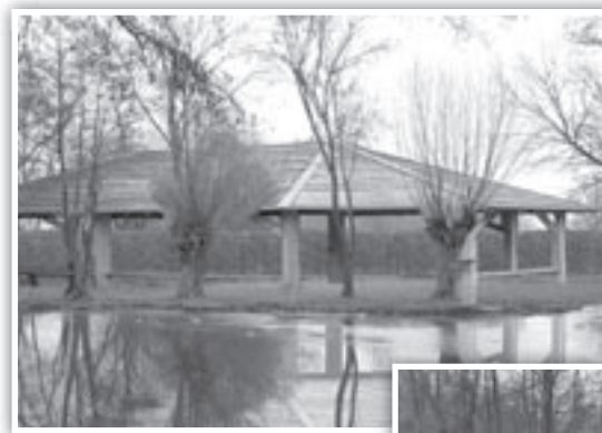
možná podoba nového velkého přístřešku