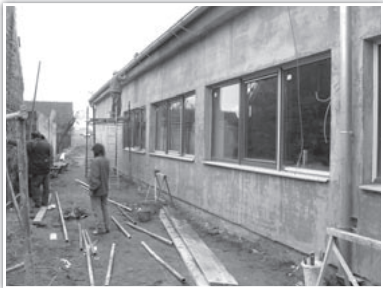
Výstavba Lidového domu