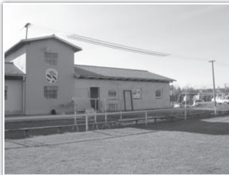
Kabiny u fotbalového hřiště